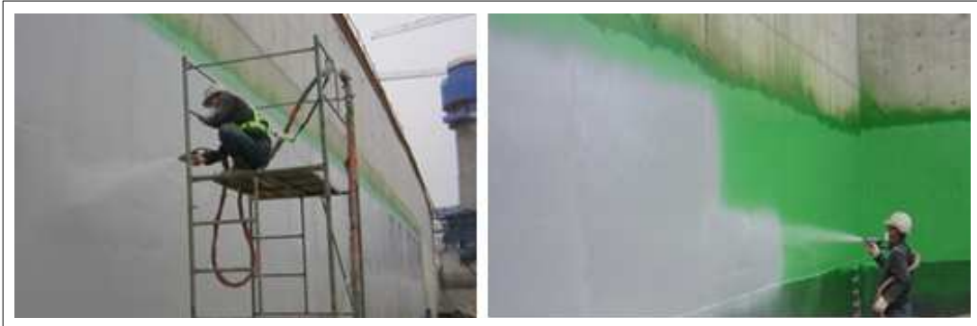
[KSC PU400 3rd 시공사진]