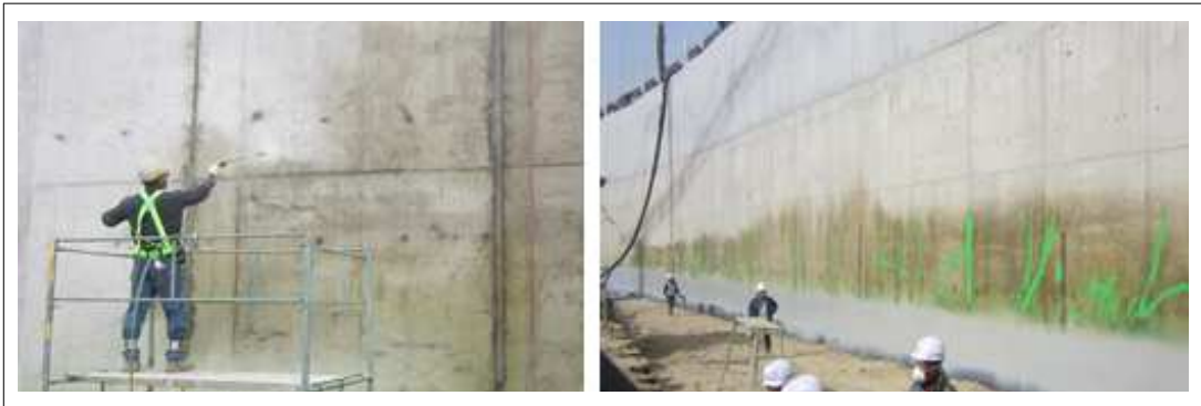
[KSC P100 1st 시공사진]