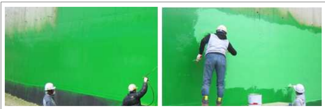
[KSC UT400 2nd 시공사진]