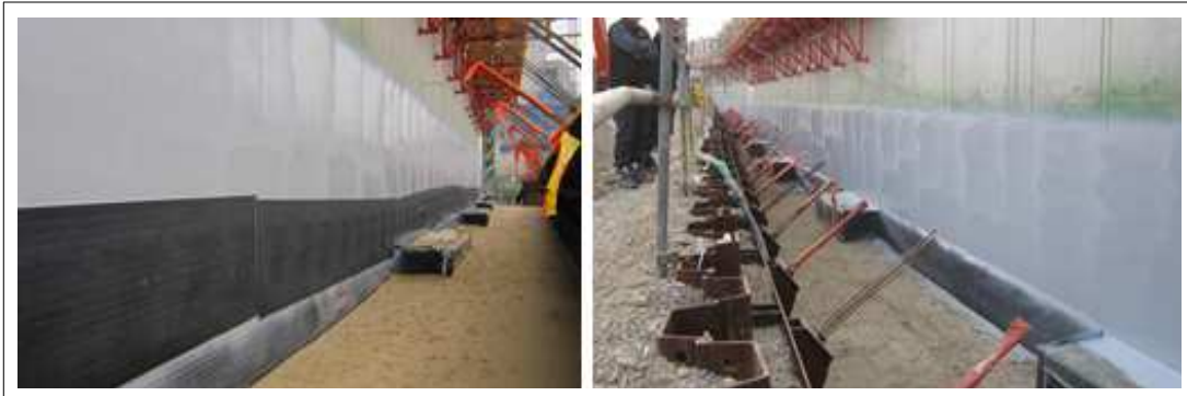
[탑코트 TC100 시공사진]

(4) 가사시간 이내 사용할 만큼만 혼합사용하고 전용희석제를 최대 25% 까지 희석하여 도포한다.