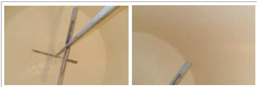
[탑코트 TC100 시공사진]

(4) 가사시간 이내 사용할 만큼만 혼합사용하고 전용희석제를 최대 25% 까지 희석하여 도포한다.