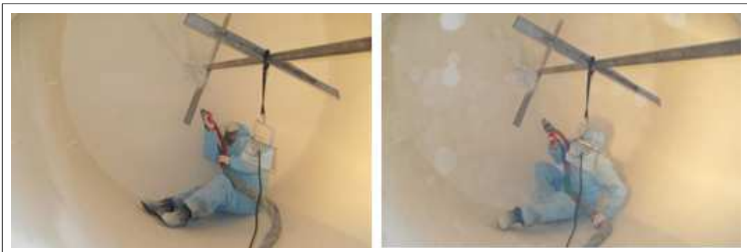
[KSC PU400 2nd 시공사진]