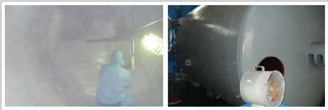
[KSC SP100 1st 시공사진]