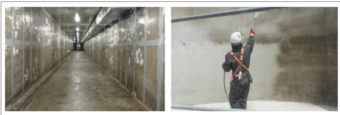
[KSC P100 1st 시공사진]