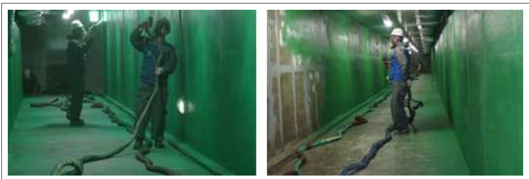
[KSC UT300 2nd 시공사진]