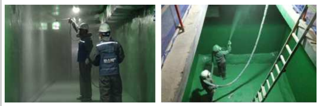
[KSC PU300 3rd 시공사진]