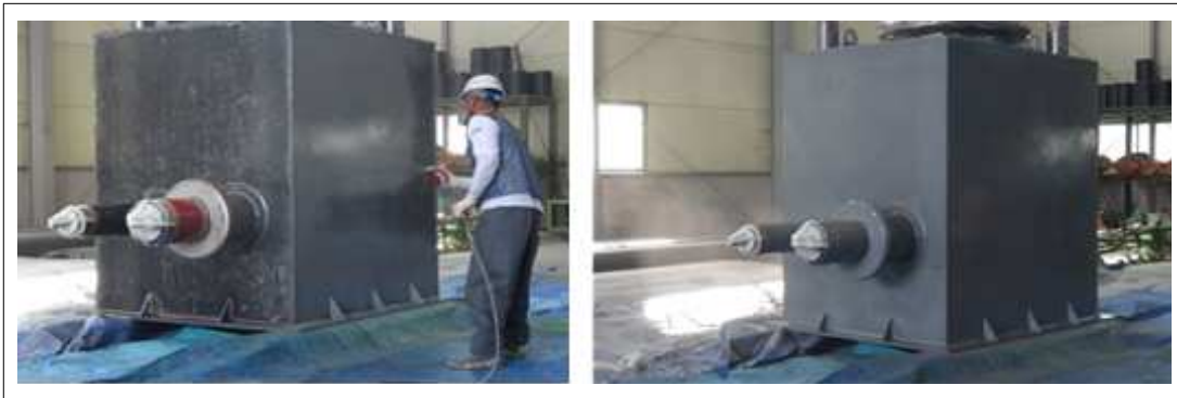
[KSC SP100 1st 시공사진]