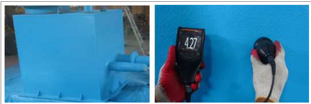
[탐코트 TC100 시공사진]

(4) 가사시간 이내 사용할 만큼만 혼합사용하고 전용희석제를 최대 25% 까지 희석하여 도포한다.