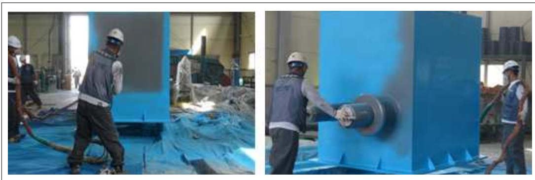
[KSC PU200 2nd 시공사진]