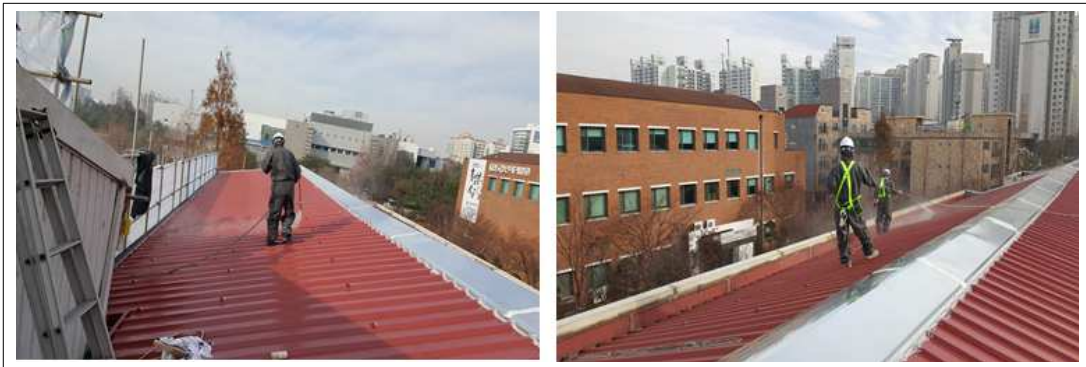
[KSC SP100 1st 시공사진]