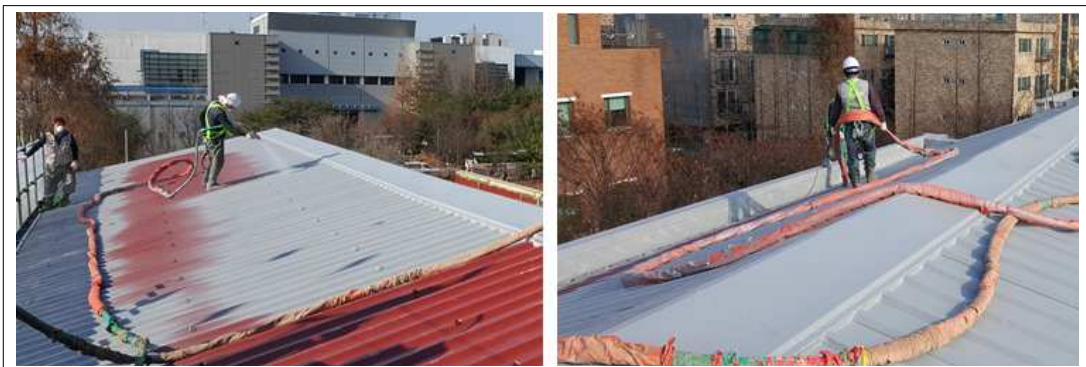
[KSC PU100 2nd 시공사진]