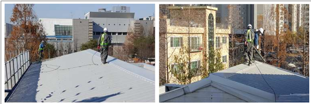
[탑코트 TC100 시공사진]

(4) 가사시간 이내 사용할 만큼만 혼합사용하고 전용희석제를 최대 25% 까지 희석하여 도포한다.